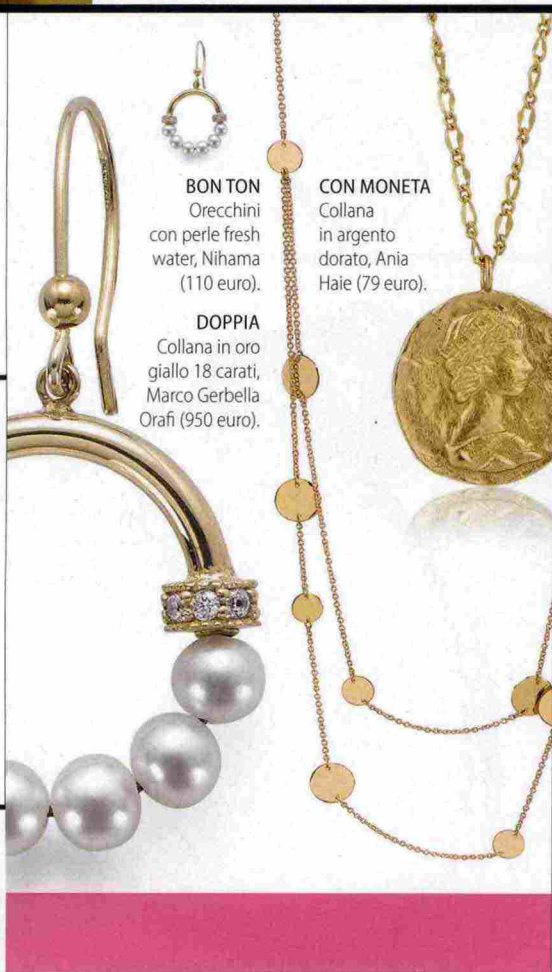
BONTON Orecchini con perle fresh water, Nihama (110 euro).