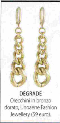
DÉGRADÉ Orecchini in bronzo dorato, Unoaerre Fashion Jewellery (59 euro).