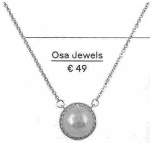
Osa Jewels € 49

Accendono gli outfit semplici, fanno scintille sui party look eccentrici: sono tutti i nuovi bijoux, tutte le pietre più desiderabili, tutti gli orologi da abbinare. E tu, sei pronta a fare bling-bling-shopping?