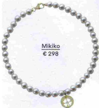
Mikiko € 298

Una sola perla come unico tocco di luce, oppure una cascata per rendere memorabile la mise. A te la scelta.