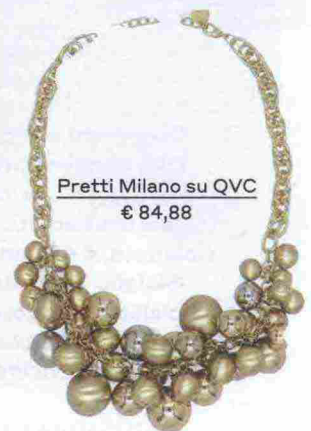
Pretti Milano su QVC € 84,88