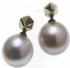
Atelier VM € 420