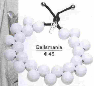
Ballsmania € 45