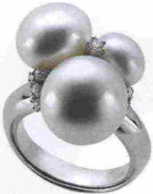
Nihama € 128