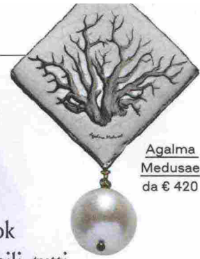
Agalma Medusae da € 420