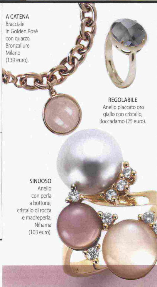
A CATENA Bracciale in Golden Rosé con quarzo, Bronzallure Milano (139 euro).