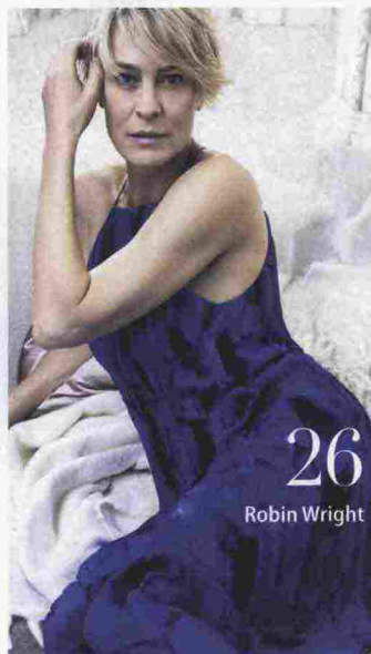
26 Robin Wright