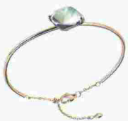
RIGIDO Bracciale in acciaio IP oro rosa con quarzo, Breil Stones (100 euro).