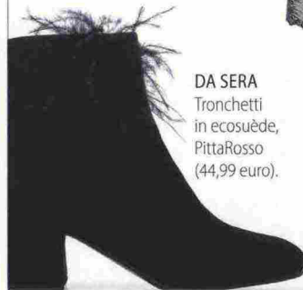
DA SERA Tronchetti in ecosuède, PittaRosso (44,99 euro).