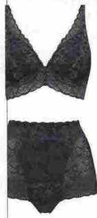
SHAPING Bralette e culotte in pizzo, Triumph (79,80 euro).