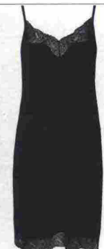
SENSUALE Sottoveste in viscosa, Verdissima (49 euro).