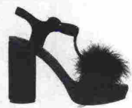
CON PLATEAU Sandali in velluto, Gioseppo (79,95 euro).