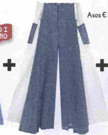
Asos € 54