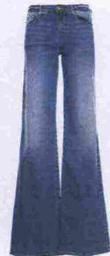
Fracomina € 107,90