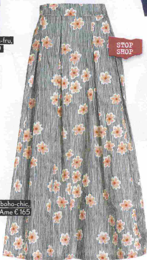
Hippy-boho-chic, Ottod'Ame € 165