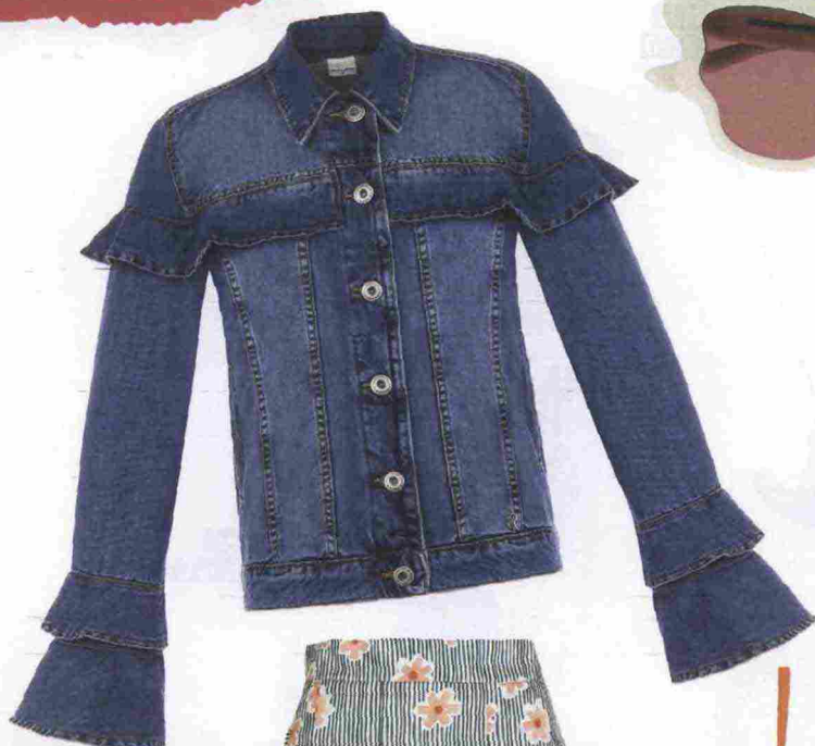
La denim jacket fru-fru, Rinascimento € 99