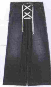
Please € 99