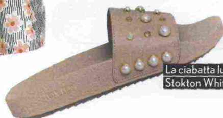
La ciabatta luxury, Stokton White € 139