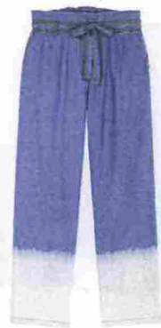
find. su amazon.it € 29