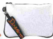
Gum Gianni Chiarini Design € 60