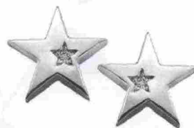
Stelle d'oro bianco e stelline di diamanti, Nihama € 328