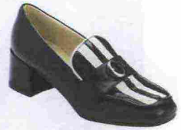
Ottod'Ame € 255