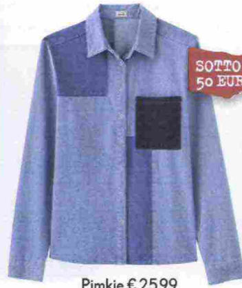
Pimkie € 25,99

MODELLO FLARED IN 50 SFUMATURE DI DENIM: NON PERDERTELI PER NESSUNA RAGIONE E POI INDOSSALI CON TOCCHI NAVY. COME NELLA SFILATA DI DIOR