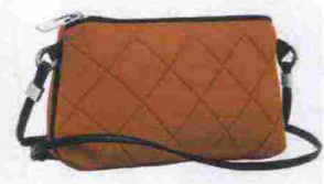
Save My Bag € 35