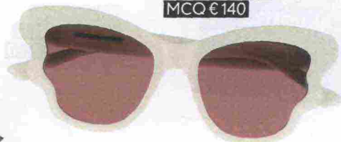
Ad ali di farfalla, MCQ € 140