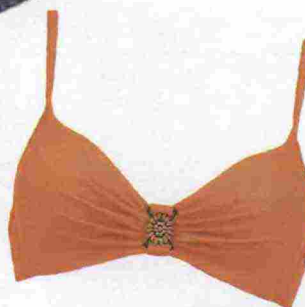
Primizia: il bikini color anguria, Sloggi € 32,90 e € 22,90