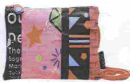
Gabs € 59

LE CROSS-BODY BAG Piatte, piccole, leggere, con la tracolla bella lunga: le streetstylist più esperte non le portano mai sulla spalla, ma le indossano di traverso, en pendant o a contrasto con il look del giorno.