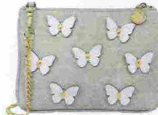
Le Pandorine € 59