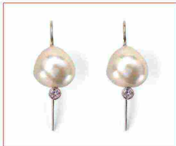
L'amore romantico coronato con la classe di Nihama