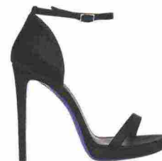
A stiletto Sandali in satin, Loriblu (395 euro).