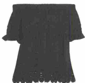
Romantica Camicia in cotone con pizzo, Joseph Ribkoff (225 euro).