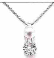
Girocollo Collana con perla fresh water e zircone, Nihama (98 euro).