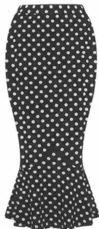
Sinuosa Gonna in cotone, WithChic (19,40 euro).

S e sei invitata a un evento particolare, calati nei panni di una star del cinema in bianco e nero. Fai come Sofia Vergara, che da quelle dive prende spesso ispirazione per i suoi look. Indossa una blusa che lasci scoperte le spalle, una gonna che valorizzi le linee della silhouette e una giacca a scatoletta dal taglio sartoriale. Il tocco strong? Un paio di sandali altissimi.