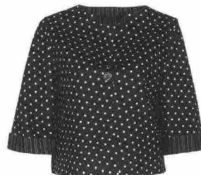
Double face Giacca in tessuto scuba, Elena Mirò (149 euro).