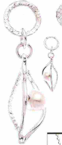
ARTIGIANALI Orecchini in argento naturale e perle d'acqua dolce, Athena Gioielli (68 euro).