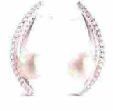
ELLITTICI Orecchini in oro bianco con perle Akoya, Alferi & St.John.