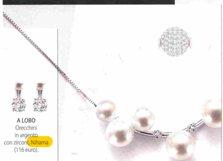
A LOBO Orecchini in argento con zirconi, Nihama (116 euro).

TOTAL LOOK Non solo gioielli, scegli anche abiti e accessori ricamati.