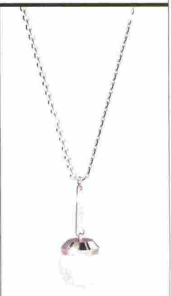
ESSENZIALE Collana in bronzo rodato, Rebecca (69 euro).