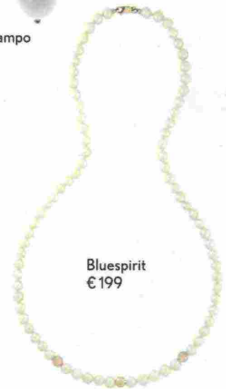
Bluespirit € 199

OROLOGI MULTIFLAVOUR AL GUSTO DI PESCA, DI MANDORLA, DI ZUCCHERO FILATO: HANNO L'EFFETTO DELLE CARAMELLE JELLY BEAN. NON SAI MAI QUALE SEGLIERE (E LI VORRESTI TUTTI)