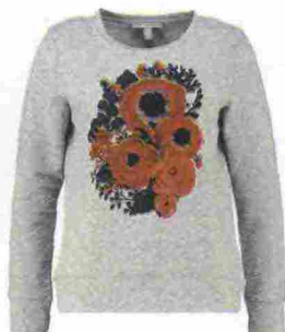
Felpa con stampa floreale, Esprit su zalando.it € 40