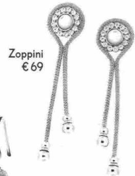
Zoppini € 69