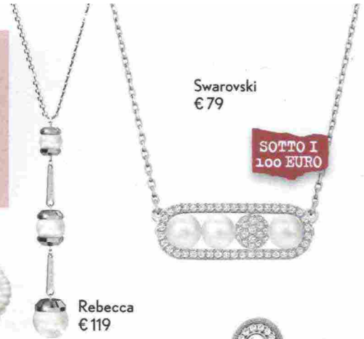
Swarovski € 79

PERLE PER LEI CAMBIA IL LADYLIKE, CAMBIANO LE PERLE. RINGIOVANITE E PIÙ SCATTANTI, STANNO AL PASSO CON LE MILLENNIALS. MAGIE DEL LIFTING!