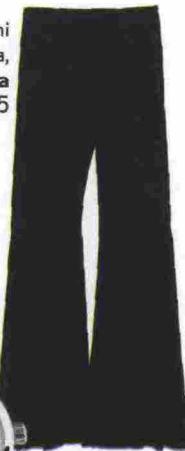
Pantaloni in viscosa, Zara € 49,95