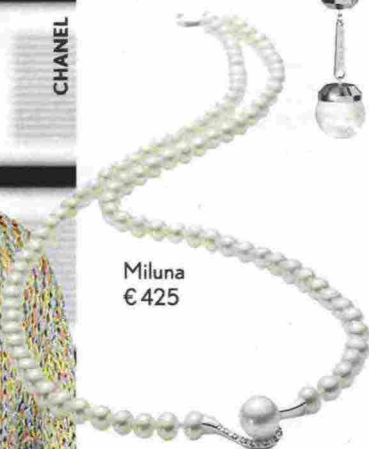
Miluna € 425