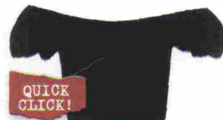
Crop top in cotone, Topshop € 20