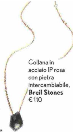
Collana in acciaio IP rosa con pietra intercambiabile, Breil Stones € 110