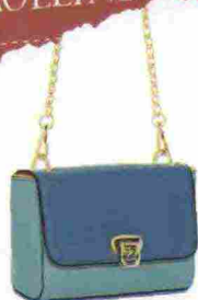
Pochette componibile in poliuretano, Numeroventidue € 65