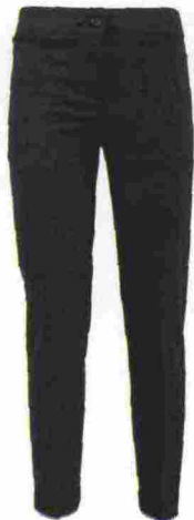
Pantaloni slim, Giorgia&Johns € 79,90