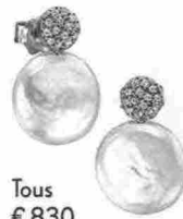
Tous € 830