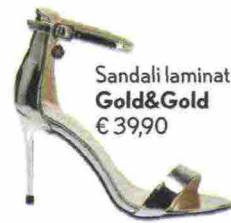
Sandali laminati Gold&Gold € 39,90