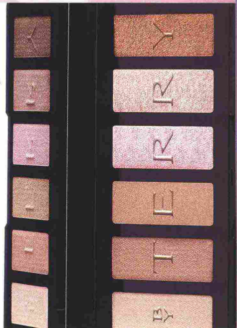
Sinfonia di ombretti nude, marroni e rosa "ghiacciati", Palette Eye Designer Techno Aura by Terry (45 euro).