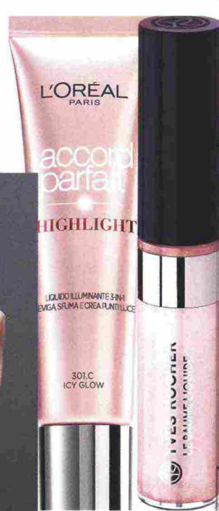
Illuminante da miscelare con il fondotinta o usare da solo, Highlight by Accord Parfait L'Oréal Paris (13,70 euro).